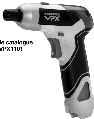
N° de catalogue VPX1101

AVANT D'APPELER, AYEZ EN MAIN LE N° DE CATALOGUE ET LE CODE DE DATE. DANS LA PLUPART DES CAS, UN REPRÉSENTANT DE BLACK & DECKER PEUT RÉSOUDRE LE PROBLÈME PAR TÉLÉPHONE. SI VOUS AVEZ UNE SUGGESTION OU UN COMMENTAIRE, APPELÉZ-NOUS. VOS IMPRESSIONS SONT CRUCIALES POUR BLACK & DECKER.